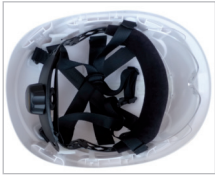
SUSPENSIÓN REF. 80649 Suspensión para casco Montana (sin barboquejo)