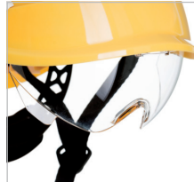
VISOR CLARO REF. 80638 Visor claro antivaho Clase óptica I Anti-impacto Resistente a los rayos UV EN 166:2002 EN 170:2003