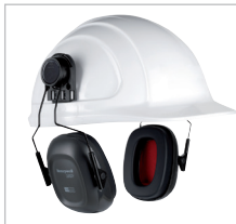
LEIGHNING L1H Ref. 82805 SNR 28 DB Cápsulas de ABS montadas sobre un dispositivo que se introduce en las ranuras de los cascos A Safe. Muy ligero: solo 171 g. Se acopla perfectamente al casco y ofrece una perfecta estabilidad en su colocación.