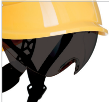
VISOR AHUMADO REF. 80639 Visor claro antivaho Clase óptica I Anti-impacto Resistente a los rayos UV EN 166:2002 EN 170:2003