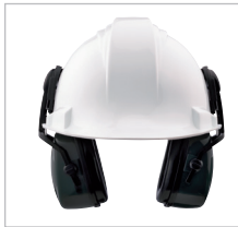
THUNDER T2H Ref. 82804 SNR 30 DB Protector auditivo DIELÉCTRICO, adecuado para todos los lugares de trabajo, especialmente para entornos eléctricos. Extra confort durante largos periodos de uso. Su carcasa externa lo hace óptimo para los lugares de trabajo más duros.