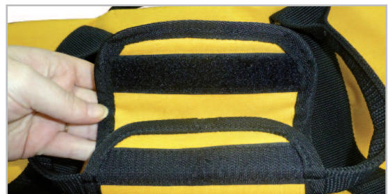
Asa con velcro