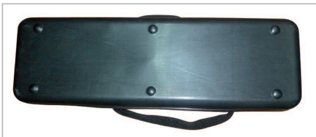
Base rígida inferior